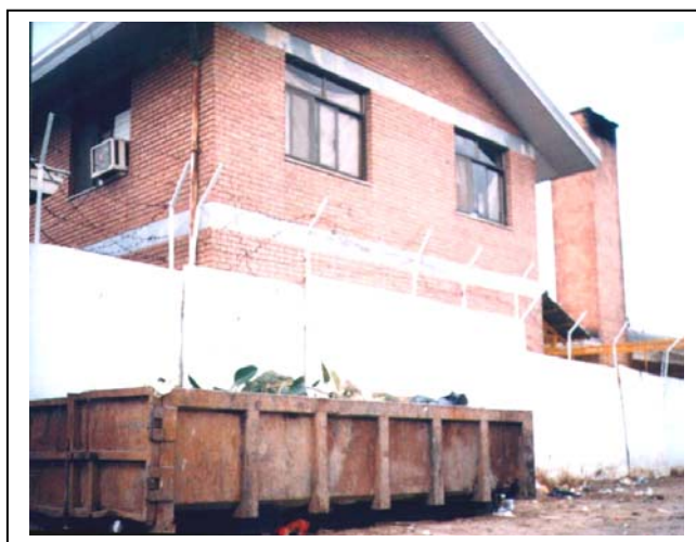
شکل‌های شماره (۱-۲): زباله تولیدی و آمیختگی با محل زیست انسانی

تولیدی، ۹۸٪ زباله خانگی، ۱٪ زباله صنعتی، ۱٪ زباله بیمارستانی در مراکز بهداشتی و درمانی است.