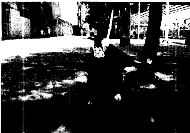
شرایط نامناسب جویهای اطراف پارک گلگون

□ معرفی اطلاعات و تجزیه و تحلیل آنها بایستی قابل اعتماد و قانع‌کننده باشد، تا اینکه جامعه سیاستگزاران را به حرکت در آورد. نمونه و سبک اطلاعات بایستی دارای جامعیت و