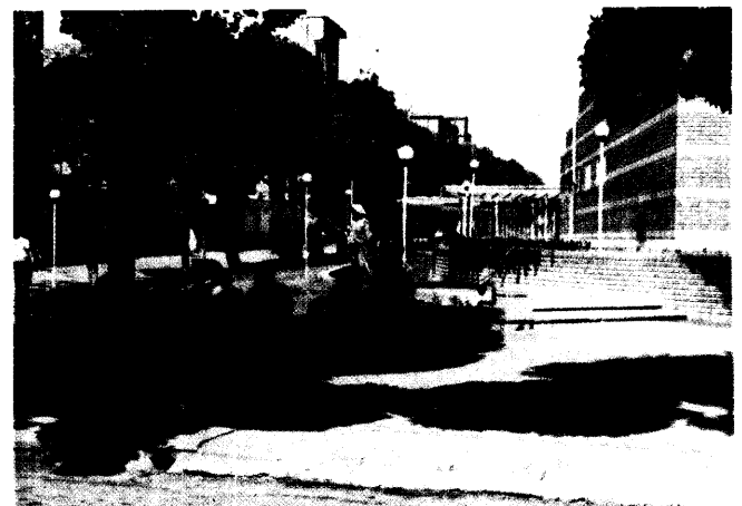
پارک کلکون در کوی سیزده آبان