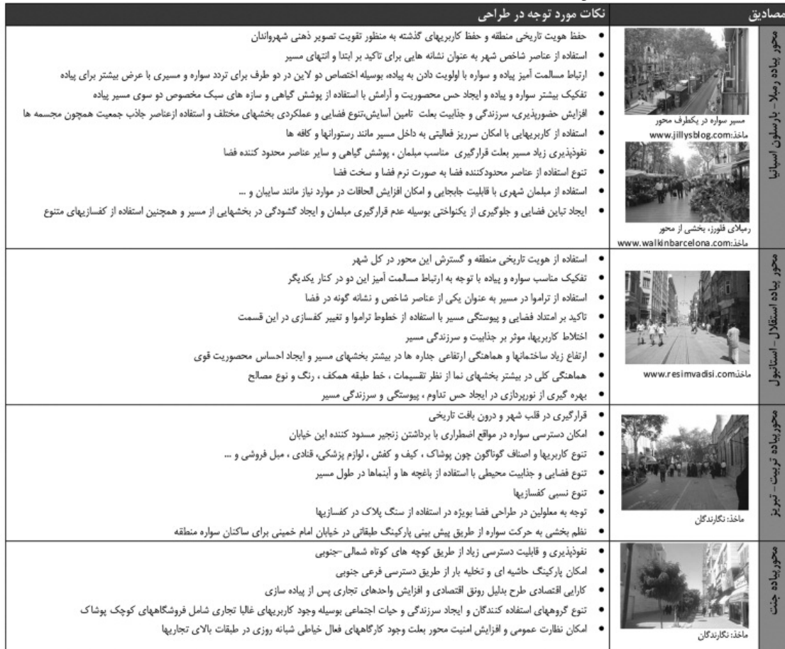
جدول ۳- کیفیت‌های مناسب طراحی در مصادیق پیاده‌راه‌ها.

پیاده‌سازی این محور در سال‌های اخیر، تداخل حرکت سواره و پیاده به حدی بود که حرکت در آن مختل می‌شد. اما با انتقال حرکت سواره به خیابان‌های اطراف و ایجاد برخی تسهیلات و تجهیزات ساده پیاده، اکنون این خیابان به عنوان یک مسیر پیاده پرتحرک و پرجاذبه هویت تازه و جدیدی پیدا کرده است. جدول ۳ مجموعه کیفیت‌های مناسب طراحی در این ۴ نمونه را ارائه می‌دهد.