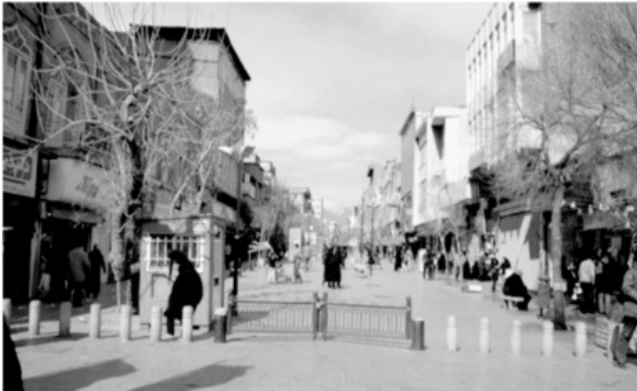
تصویر ۱- ورودی خیابان صف (سپهسالار) از خیابان جمهوری.