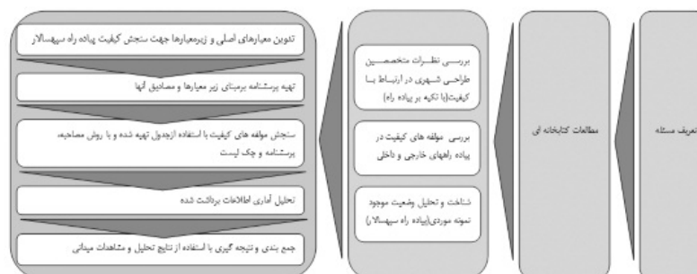
نمودار ۱ - فرایند پژوهش.

در این مقاله پس از درک ضرورت احداث پیاده راه ها و ارائه تعریف و تاریخچه ای از آنها، تمرکز بر ارائه مولفه های کیفی مورد توجه برای طراحی مطلوب اینگونه فضاهای شهری می باشد. بدین منظور ابتدا مبانی نظری پیرامون کیفیت های فضاهای شهری مطلوب بطور عام مورد بررسی قرار گرفته، سپس در یک مقایسه تطبیقی بین معیارهای کیفیت و ماهیت پیاده راه به عنوان یک گونه فضای شهری، معیارهایی که ماهیت نزدیک تری به پیاده راه داشته اند، انتخاب گردیده است. در ادامه مولفه های کیفی بکاررفته در چند نمونه از پیاده راه های اجرا شده در خارج و داخل از ایران تجزیه و تحلیل گردیده است. تطبیق معیارهای بدست آمده از این دو مرحله با تحلیل وضعیت موجود پیاده راه، مدل ویژه سنجش کیفیت پیاده راه سپهسالار را در اختیار قرار داده است. لذا می توان گفت معیارهای نهایی در ترکیب مقایسه تطبیقی در مبنای نظری،