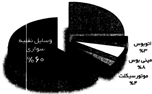
نمودار سهم انواع وسایل نقلیه موتوری در آلودگی هوای تهران