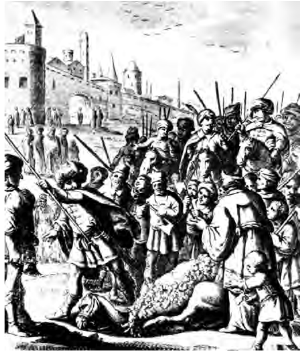
تصویر ۱- مراسم عید قربان در دوران صفوی.

علاوه بر اینکه میدان نقش جهان و خیابان چهارباغ محلی برای برگزاری مراسم، جشن ها و نمایش های عمومی بوده اند، اصولاً برای این منظور طراحی شده اند. عمارت های بالای سر در ورودی در خیابان چهارباغ و ایوان های طبقه دوم در اطراف میدان نقش جهان برای این پیش بینی شده اند که بتوان در آنها نشست و مراسم و نمایش را در خیابان و میدان دید (اهری، ۱۳۸۵، ۵۲) (ر.ک. به تصویر ۲). خیابان چهارباغ و میدان نقش جهان با طراحی اندیشیده و کالبدی مناسب در به نمایش گذاشتن دستاوردهای شهر و ایجاد زمینه ای برای آیین های عمومی؛ خصوصیتی که به گفته کوستوف از ویژگی های فضای عمومی است (Kostof, 1992, 194) ۸ ، کاملاً موفق است. در واقع