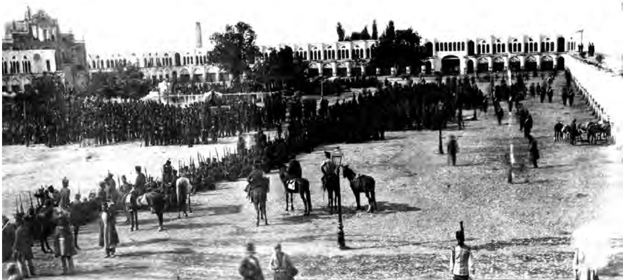
تصویر ۳- مراسم جشن شربت خوران به مناسبت تولد ناصرالدین شاه در میدان توپخانه

هنوز هم مراسم عید قربان در آن برگزار می شود. توضیح این مراسم را به تفصیل در سفرنامه های سیاحان فرنگی که به ایران آمده اند و یا خارجیان مقیم ایران و به صورت مختصر در نوشته ها و خاطرات ایرانیانی مثل مخبرالسلطنه (۱۳۷۵) و معیرالممالک (۱۳۶۲، ۶۱-۶۲) می توان یافت. این مراسم را اورسل چنین نقل می کند: