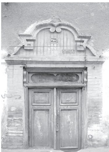
تصویر ۱۰- سردر سنتوری خانه ای به سبک تلفیقی در محله عودلاجان.