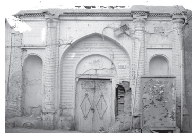
تصویر ۷- نمایی از ورودی خانه ای تلفیقی واقع در حاشیه معبری فرعی در محله بازار.