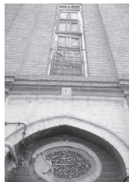
تصویر ۱۹- بخشی از نمای ورودی خانه اروپایی محله چال میدان.

در محله سنگلج، خانه های سنتی، پیشطاقی هلالی یا بیضی و همچنین سردری ساده یا نعلی به همراه کتیبه دارند. خانه ها معمولاً دارای هشتی و دالان و گاه هشتی بدون دالان یا دالانی تک هستند (جدول ۱ و ۲، شماره های ۲۰، ۲۱).