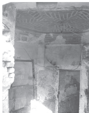
تصویر ۵- فضای هشتی و ورودی دالان خانه ای سنتی در محله عودلاجان.