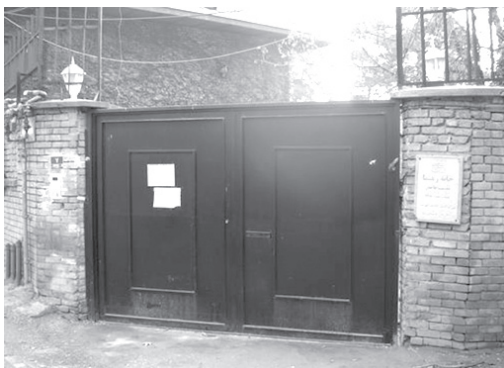
تصویر ۱۷- خانه اروپایی رهنما واقع در منطقه نیاوران.