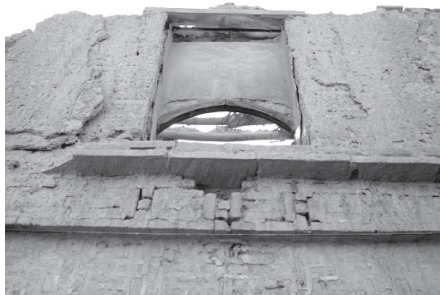
تصویر ۴- نمایی از بالاخانه سنتی خانه ای در محله چال میدان.

عمق آن حدود ۰/۵ متر و در خانه ها بیشتر مستطیل شکل و دارای ابعادی در مقیاس انسانی بود (سلطان زاده، ۱۳۷۱، ۱۲۸)؛ البته در مواردی، درهای کوتاه نیز دیده می شد، اما آستانه بلند پای در ۲ که گذرنده را وادار به پایینیدن پیش پای خود می کرد، خطر اصابت سر به آن را تا حدی از بین می برد. این درها معمولاً چوبی و دو لنگه بود ۳ و هیچ لولایی در آنها تعبیه نشده بود، بلکه روی پاشنه می چرخید ۴ . روی در، گلمیخ های فلزی (با اشکال متنوع) و دوکوبه به شکل های گوناگون - هر کدام بر روی یک لته در - نصب می شد که کارکرد آنها، اطلاع رسانی برای حفظ محرمانیت بود. گاهی نیز در قسمت داخلی در، چفت و کلون به کار می رفت که مقاومت در را تکمیل می کرد (ابوالقاسمی، ۱۳۸۴، ۱۲۳). این درها معمولاً فاقد روزن بود، اما در مواقعی که نور کافی برای هشتی تأمین نمی شد، در بالای در، روزنی کوچک قرار می گرفت (سلطان زاده، ۱۳۷۲، ۱۰۲) تا نور معبر را به درون هشتی هدایت کند. سردر خانه ها یا کاملاً ساده بود و یا تزیینات کم مایه ای از آجرکاری، گچبری یا تلفیقی از آنها را بر سطح خود داشت که این تزیینات نیز متناسب با وضعیت و موقعیت اجتماعی و به فراخور حال صاحبخانه بود. اورسل در این باره می نویسد: «اگر صاحبخانه به زیارت مکه توفیق یافته بود تصویر درختان سرو را بالای سردر خانه اش گچبری می کرد و مردم از این تصاویر می دانستند که اینجا خانه یک حاجی است» (اورسل، ۱۳۵۳، ۱۱۷). بر سطح سردر، کتیبه های