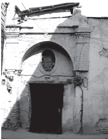
تصویر ۹- روزن بیضی شکل خانه ای تلفیقی واقع در هشتی متصل به معبر محله چال میدان.

نمای خانه های تلفیقی، بیشتر از آجر و ورودی آنها دارای عناصری مانند پیشطاق (گاهی بدون پیشطاق)، سکو (گاه فاقد سکو)، درگاه، در - با روزن و گاهی کوبه و کلون - سردر، هشتی (زمانی بدون هشتی)، دالان (گاه بدون دالان) یا راهرو بود. عمق ورودیها معمولاً در حدود ۰/۵ متر، عرض آنها بین ۳ تا ۴ متر و ارتفاع آنها بین ۳ تا ۴/۵ متر بود (سلطان زاده، ۱۳۷۱، ۴۴، ۱۳۴). پیشطاق بیشتر خانه ها، هلالی شکل و دارای تزیینات آجر یا کاشی بود. گاهی اوقات نیز در طرفین پیشطاق، دو طاقنما، دو ستون یا نیم ستون تزیینی و دو سکو قرار می گرفت که اغلب اوقات این سکوها، سطح کافی برای نشستن نداشت و تنها برای ایجاد ترکیب شکلی و فضایی یا به عنوان عنصری تزیینی به کار می رفت (تصاویر ۷ و ۸).