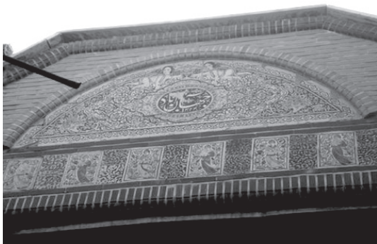
تصویر ۱۸- سردر سنتوری و سرتاسر کاشیکاری شده خانه ای اروپایی در محله بازار.

همانگونه که پیشتر ذکر شد، اکثر خانه ها دارای پنجره بودند، اما این پنجره به تدریج به عنوان عنصری مهم در نمای خارجی، در ترکیب معمارانه با فضای ورودی قرار گرفت و در بخش بالایی سردر بعضی از خانه ها به کار گرفته شد (تصویر ۱۹). البته پنجره تنها عنصری نبود که در ترکیب با فضای ورودی به کار رفت، بلکه رخیام، دست انداز بالایی بام، قرنیز، ازاره و سطح دیوار هم از عناصر و سطوحی بودند که در برخی از ترکیب ها به کار برده شدند و نمایی متفاوت به فضای ورودی بخشیدند.