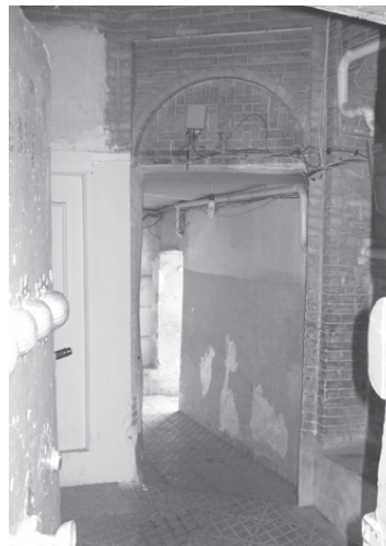
تصویر ۱۲- نمایی از هشتی سکودار و دالان خانه ای تلفیقی در محله سنگلج.

در مورد سردر و پیشطاق باید گفت که تزیینات آنها، رابطه نسبتاً مستقیمی با وضعیت اقتصادی، موقعیت اجتماعی، روحیه مذهبی و سلیقه صاحبخانه داشت. خانه ها دارای هشتی و دالان (گاه هشتی و دالان به صورتی مجزا) و یا تنها یک راهرو بودند. هشتی دارای تزییناتی متنوع تر از گذشته بود و سقف آن، گاهی ساده و آجری بود و گاه با تیرهای چوبی، یک لایه گچ یا کاربردی های آجری و گچی پوشیده می شد. دالان نیز در بیشتر خانه ها با همان عملکرد پیشین خود باقی ماند، اما در برخی موارد، پوشش روی دالان را برداشته و آن را تبدیل به راهرو کرده اند (تصاویر ۱۲ و ۱۳).