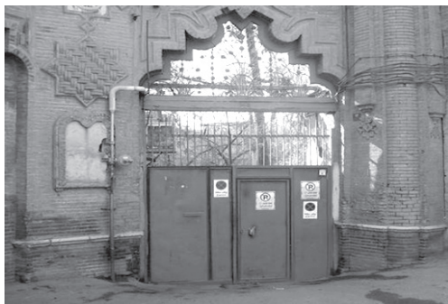
تصویر ۱۶- نمایی از خورشیدی کله در و درب ورودی خانه اتحادیه در محله دولت.