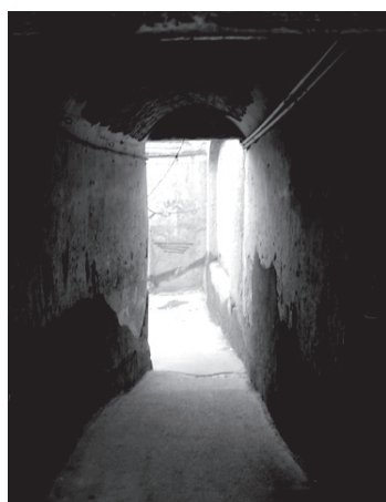
تصویر ۶- دالان مستقیم خانه ای سنتی در محله چال میدان.