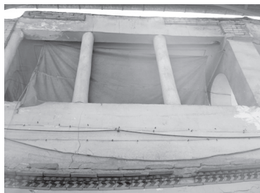
تصویر ۱۱- بالاخانه ستوندار خانه ای تلفیقی در محله بازار.

در مورد سردر و پیشطاق باید گفت که تزیینات آنها، رابطه نسبتاً مستقیمی با وضعیت اقتصادی، موقعیت اجتماعی، روحیه مذهبی و سلیقه صاحبخانه داشت. خانه ها دارای هشتی و دالان (گاه هشتی و دالان به صورتی مجزا) و یا تنها یک راهرو بودند. هشتی دارای تزییناتی متنوع تر از گذشته بود و سقف آن، گاهی ساده و آجری بود و گاه با تیرهای چوبی، یک لایه گچ یا کاربردی های آجری و گچی پوشیده می شد. دالان نیز در بیشتر خانه ها با همان عملکرد پیشین خود باقی ماند، اما در برخی موارد، پوشش روی دالان را برداشته و آن را تبدیل به راهرو کرده اند (تصاویر ۱۲ و ۱۳).