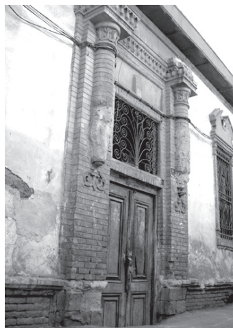
تصویر ۱۵- فضای ورودی خانه ای به سبک اروپایی در محله چال میدان.