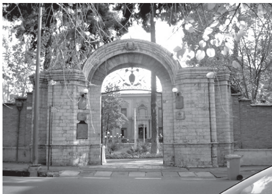
تصویر ۱۴- نمایی از ورودی اروپایی خانه قوام السلطنه واقع در حاشیه خیابانی در محله دولت.

فضای ورودی خانه های سبک اروپایی - مخصوصاً آنهایی که در کنار خیابان ها قرار می گرفتند - در میان یکی از جبهه های اصلی بنا و روی محور تقارن، طراحی و ساخته می شد، اما باز شدن پنجره هایی که معمولاً در یک سمت ورودی یا در دو سوی ورودی ولی با فاصله هایی مختلف از آن یا با اختلاف عددی قرار می گرفتند، تا حدودی این اصل تقارن را به هم می ریخت. دیوار خانه ها، آجری و گاه کوتاه تر از دوره های قبل بود و فضای ورودی در درگاه، در - معمولاً با ترکیباتی چون روزن و پنجره - سردر (گاه بدون سردر) و در مواردی راهرو خلاصه می شد و از دیگر اجزاء و عناصر ورودی مانند پیشطاق، سکو، کوبه، هشتی و دالان - که بیانگر سلسله مراتب ورود، نشان دهنده درونگرایی خانه ها و تأمین کننده محرمت و امنیت بودند - در آنها خبری نبود؛ بدین ترتیب در خانه ها مستقیماً به داخل حیاط یا فضای اصلی خانه گشوده می شد و نحوه ورود کاملاً مستقیم بود (تصویر ۱۴).