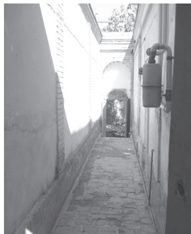
تصویر ۱۳- راهروی ورودی خانه مؤمن الاطباء در محله عودلاجان.