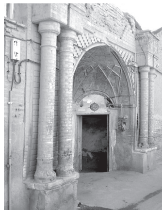
تصویر ۸- ورودی اختصاصی و سبک تلفیقی خانه ای در محله سنگلج.