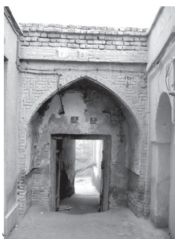
تصویر ۲- میدان.

ورودی خانه های سنتی دارای اجزاء و ترکیبات تقریباً واحدی چون پیشطاق، سکو، درگاه، در - به همراه اجزایی چون آستانه، کوبه، کلون، گلمیخ و گاهی روزن - سردر، هشتی و دالان بود که این اجزاء و عناصر نه تنها امکان دیدار، گفتگو، توقف، انتظار و ورود را فراهم می کرد، بلکه واردشوندگان را بر حسب جنس (زن یا مرد)، کیفیت حضور (حضور در شب یا روز، در خواب یا بیداری، در هنگام استراحت یا زمان کار، در تنهایی یا جمع، در زمستان یا تابستان، در کنار طبیعت یا دور از آن) و رابطه آنها با خانواده (رابطه فردی یا جمعی، شخصی یا اجتماعی، کوتاه مدت یا درازمدت) به فضاهای مختلف خانه هدایت می کرد (هاشمی، ۲۰۱۳۷۵). پیشطاق خانه ها معمولاً به شکل جناغی و گاه به صورت بیضی یا هلالی بود و سقف آنها اغلب ساده و یا با کاربندی های آجری و گچی تزیین می شد. سکوه های آجری یا سنگی دو سوی پیشطاق، حالتی نیمه خصوصی داشت، زیرا هم هنگام گفتگوی صاحبخانه با همسایه ها یا مراجعین با اهالی خانه، از آن استفاده می شد و هم هنگام انتظار و رفع خستگی، بدون کسب اجازه از صاحبخانه، مورد استفاده مراجعان یا عابران قرار می گرفت و این کار، یکی از الگوهای رفتاری و عادات بارز مردم آن زمان محسوب می شد (میرزایی و دیگران، ۱۳۸۵، ۱۹۰). اندازه درگاه خانه ها معمولاً ۱/۵ متر و