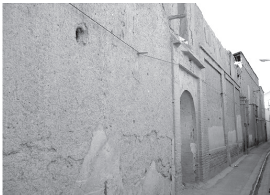
تصویر ۱- دیوارهای بلند و ساده خانه ای سنتی واقع در حاشیه معبری باریک در محله چال میدان.